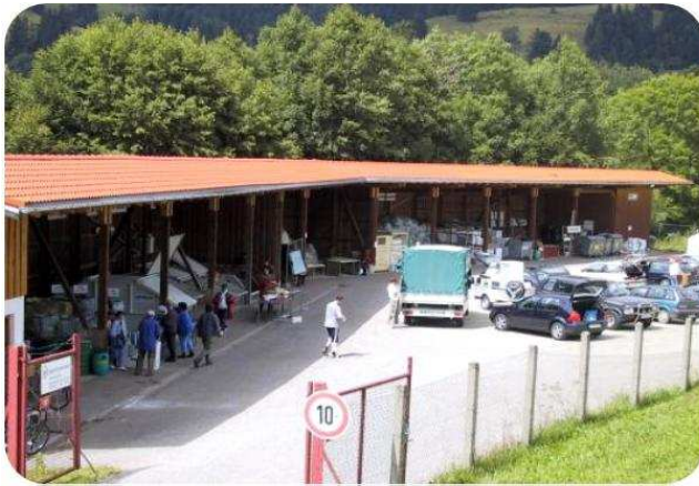
Punto Limpio simple de Alemania