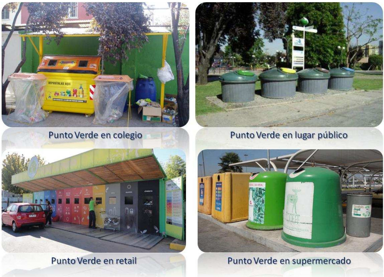
Figura 4-1 Ejemplos de Puntos Verdes en Chile

Algunos pocos PV cuentan con atención de personal y con contenedores para más materiales reciclables, como se puede observar a la izquierda abajo en la siguiente figura.