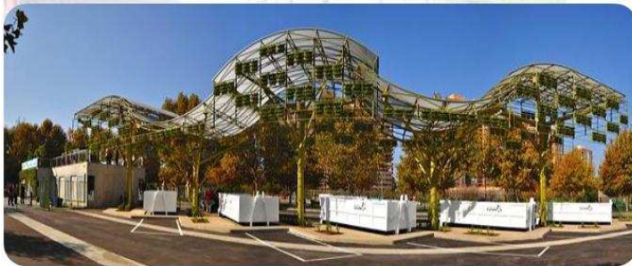
Punto Limpio de Las Condes