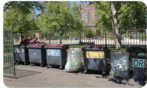
Sección de Envases y Embalajes del Punto Limpio de Las Condes