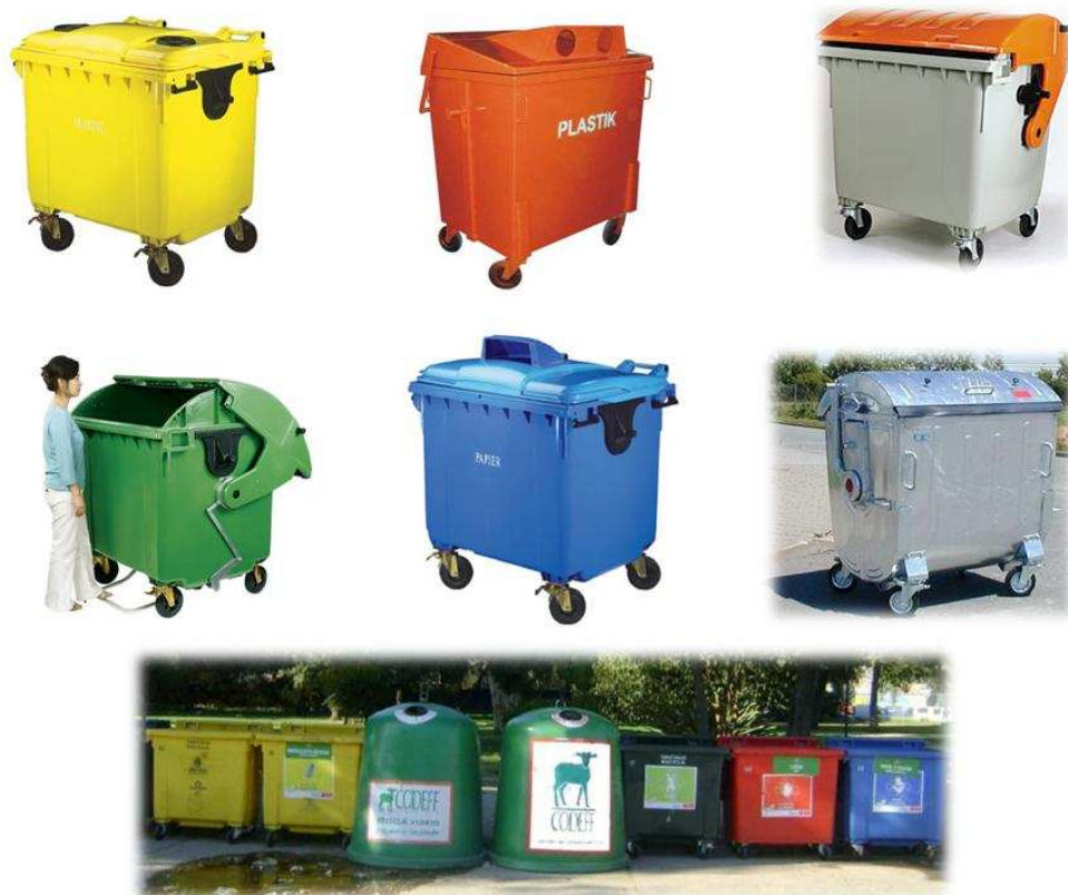
Figura 4-2 Ejemplos de contenedores MGB