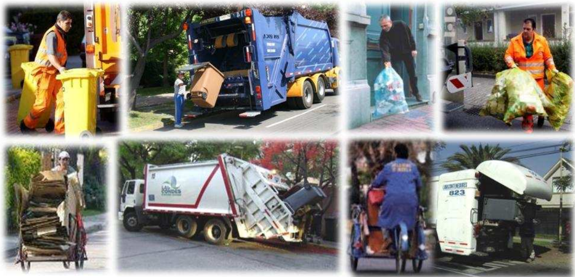
Figura 4-6 Ejemplos de recolección selectiva puerta a puerta

La recolección selectiva puerta a puerta se puede efectuar con camiones o también con recicladores de base. De acuerdo a la experiencia internacional, se recomienda recoger los “EyE livianos” de plástico, metal y multicomponentes en forma conjunta y mezclada en contenedores o en bolsas desde las casas. Después, para separar este conjunto de residuos livianos, se requiere de plantas de clasificación (PdC), generalmente con cintas transportadoras, desde los cuales son transportados a los centros de valorización (destinos).