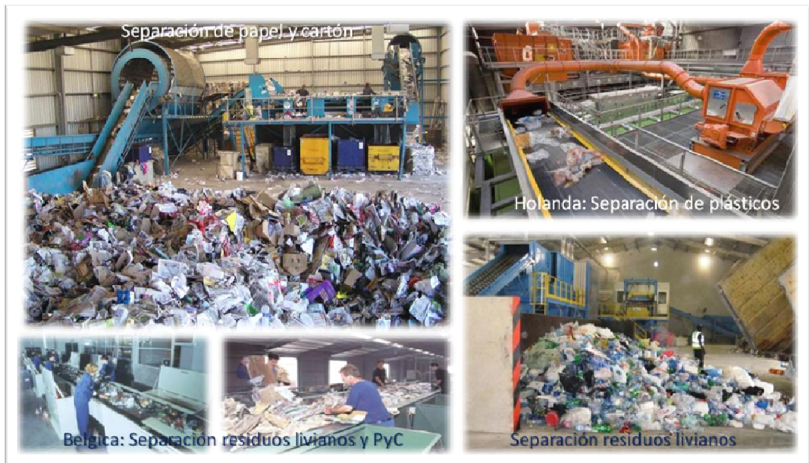
Figura 4-5 Ejemplo de plantas de clasificación de residuos