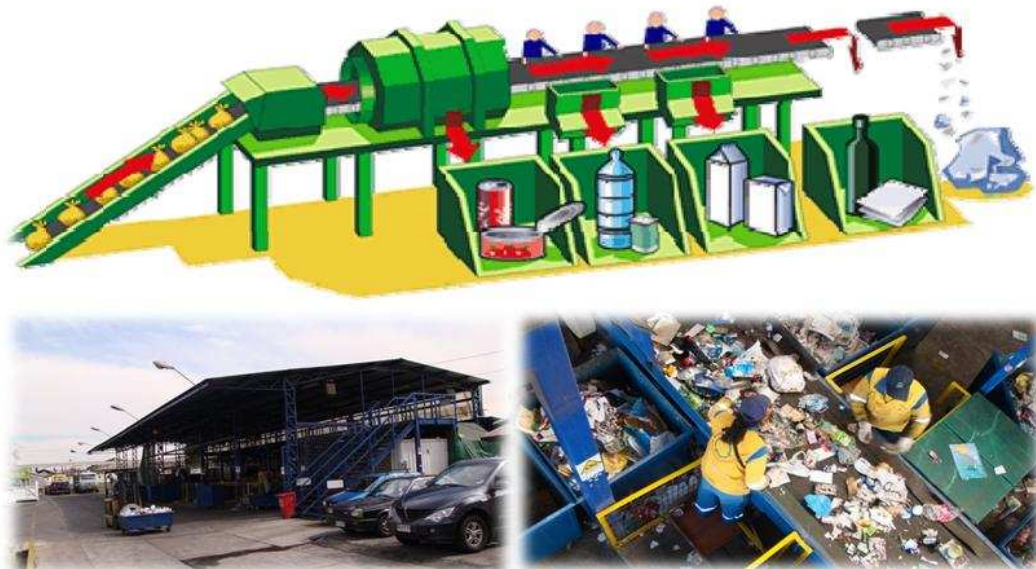
Figura 4-4 Funcionamiento de una Planta de Clasificación Manual

Estas PC se generalmente se compone de cintas transportadoras para la clasificación manual y equipamiento mecanizado para la separación de materiales. Generalmente trabaja bastante personal en la clasificación en cinta, si se trata de una planta de clasificación manual. Un ejemplo en Chile es la PC con clasificación en Ñuñoa (ver fotografías en la siguiente figura).