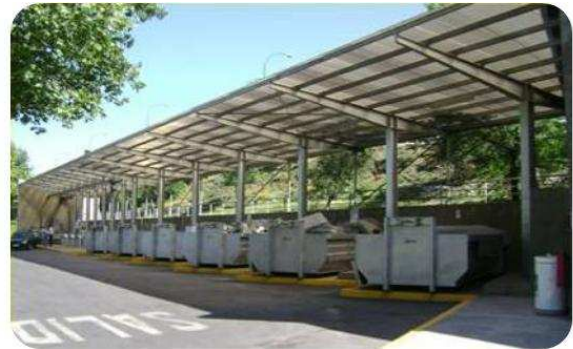
Punto Limpio de Vitacura