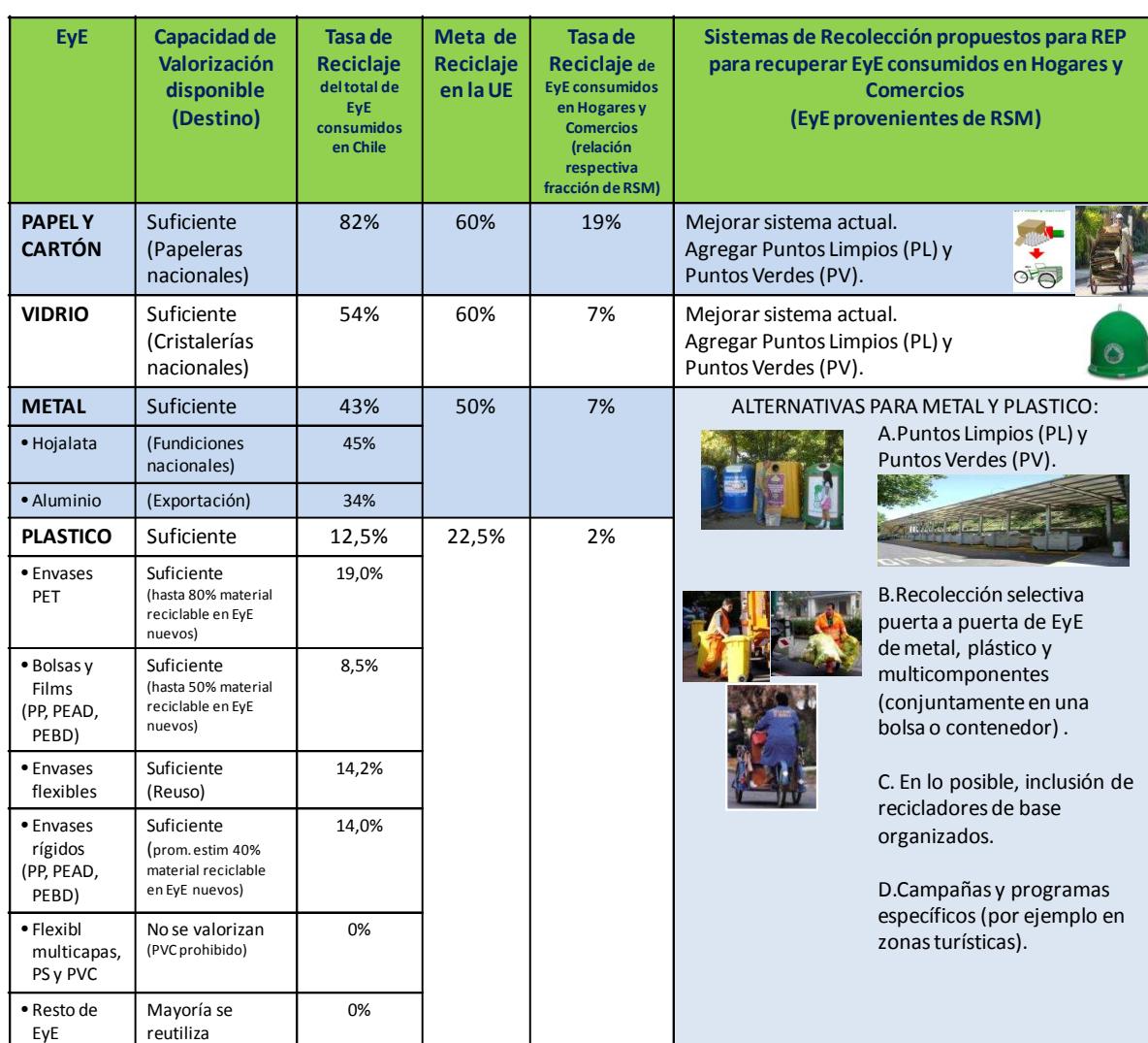
Tabla 4-3 Proposición general de sistemas de recuperación por tipo de EyE

Basado en las tasas actuales de recuperación y valorización, y del análisis anterior de los sistemas actuales de recolección, se propone las siguientes alternativas de recuperación por tipo de EyE para mejorar los resultados de valorización a nivel nacional en el contexto de la REP.